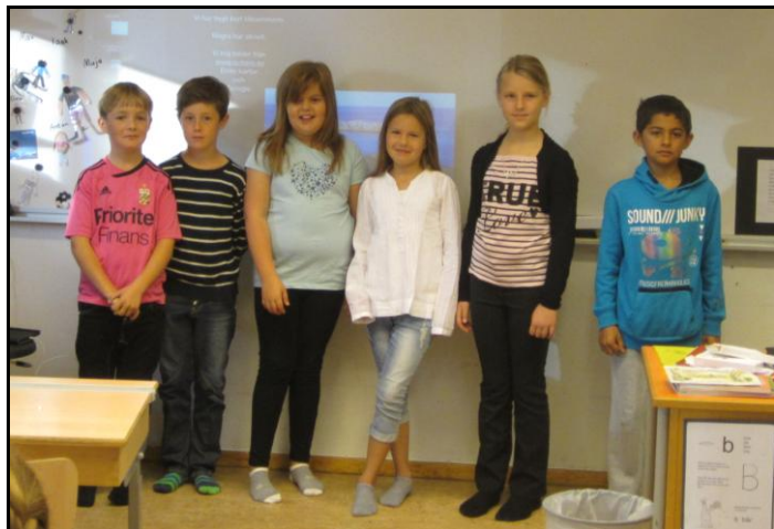
Fokusgrupp skola. En av de redovisande grupperna på Bergagårdsskolan klass 3K ovan. Del av klass 8C på Brattebergsskolan nedan.

Ännu en gång, ett stort tack till alla som varit med och arbetat i och under fokusgrupperna!