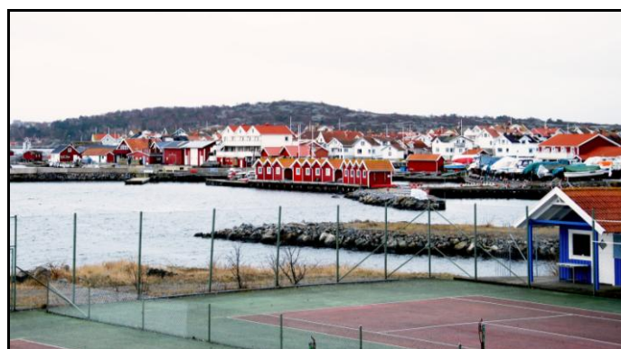
Ovanstående foton föreställer Källö-Knippla.