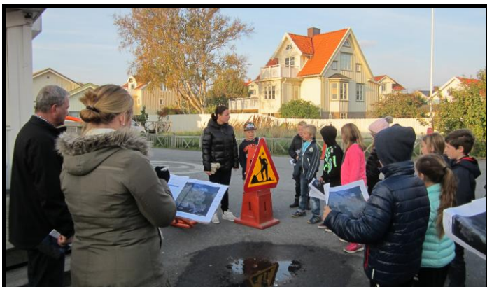
Trygghetsvandring på Hönö med klass 3K på Bergagårdsskolan.

För att följa upp och studera de platser som eleverna pekat ut som otrygga, har trygghetsvandringar genomförts med elever, lärare, tjänstemän och politiker under september och oktober. Resultatet av trygghetsvandringarna redovisas i rapporten som nämns ovan.