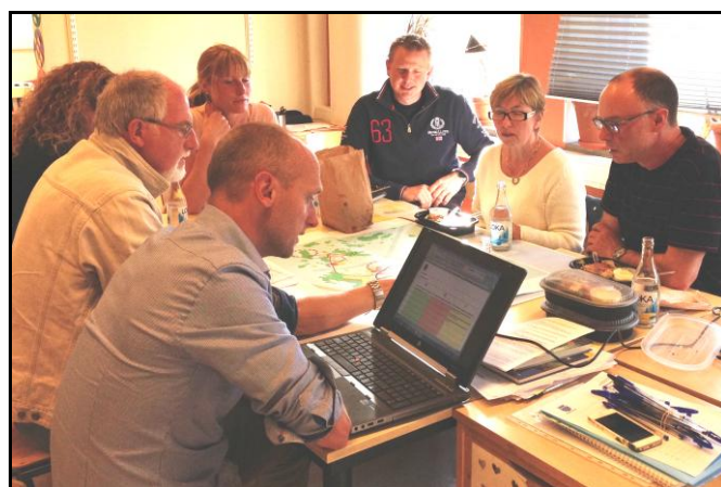
Fokusgrupp boende från Hönö

Ett stort tack till alla som varit med och arbetat i och under fokusgrupperna!