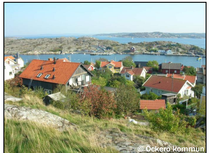
Foto över Kalvsund och Framnäs på Björkö.

Syftet med förstudien är att skapa förutsättningar för ett framtida fördjupat samarbete i kustzonen. Förstudiens resultat är tänkt att föras in i en framtida "blå översiktsplan" som kommunen arbetar fram som ett separat dokument till den nya översiktsplanen, ett så kallat tematiskt tillägg till ÖP Utblick Öckerö.